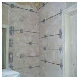
Collegamenti attivi tra setti murari (Vittoria)

Le recenti normative per le costruzioni in zona sismica ( D.M. 14-1-2008, D.L. 74-2012 e relative Linee Guida ), introducono nuovi impegni per le pubbliche amministrazioni, proprietarie di edifici la cui funzionalità, durante gli eventi sismici, assume rilievo fondamentale per le finalità di protezione civile (es. ospedali, municipi, caserme, ecc.) e/o di edifici che possono assumere rilevanza in relazione alle conseguenze di un eventuale collasso (es. scuole, teatri, ecc.), senza trascurare quegli edifici sede di attività produttive qualificate, la cui interruzione causerebbe gravi perdite economiche all'impresa. Per tali edifici strategici e rilevanti è fatto obbligo di procedere alle verifiche strutturali ai sensi dell'art. 3 dell'Ordinanza del Presidente del Consiglio dei Ministri n. 3274, cui si sono aggiunte le richieste e i procedimenti segnalati dal D.L. 74/2012). Una volta determinato l' effettivo stato di consistenza strutturale dell'edificio , e l'esposizione dello stesso al rischio in caso di evento sismico, si possono proporre gli interventi atti alla messa in sicurezza dell'edificio stesso miglioramenti e/o adeguamenti sismici. Lo scopo della nuova normativa è anche quello di permetterci di usufruire di edifici e strutture che garantiscano un elevato livello di sicurezza , soprattutto in caso di eventi eccezionali per gli edifici stessi.