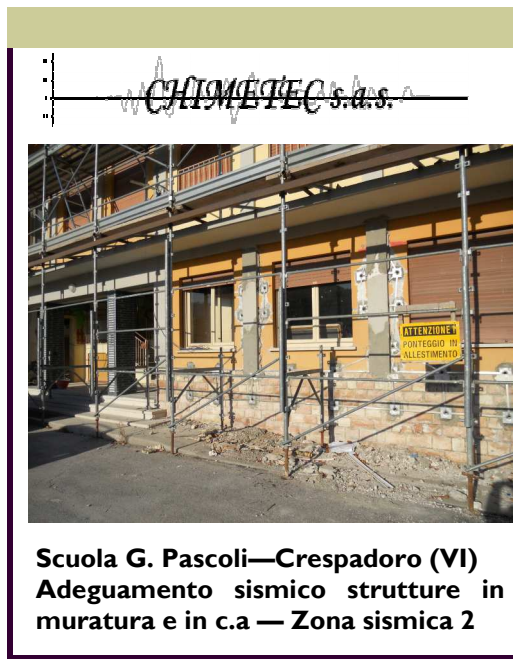
Scuola G. Pascoli—Crespadoro (VI) Adeguamento sismico strutture in muratura e in c.a — Zona sismica 2

MESSA IN SICUREZZA MIGLIORAMENTO E ADEGUAMENTO SISMICO EDIFICI INDUSTRIALI ED ABITATIVI IN C.A. E MURATURA CON SISTEMA C.A.M. SECONDO LE LINEE GUIDA DEL D.M. 14-1-2008 E DEL D.L. 74/2012