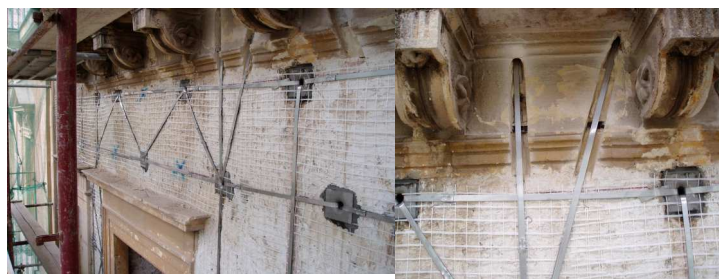
Cordolo tipo alla Giuffrè ai piani intermedi in continuità con la maglia diffusa applicata all'intero prospetto alto 15 m per la sua messa in sicurezza prima della demolizione della parte interna del fabbricato e la successiva costruzione dell'edificio in C.A. (Vittoria).

MESSA IN SICUREZZA MIGLIORAMENTO E ADEGUAMENTO SISMICO EDIFICI INDUSTRIALI ED ABITATIVI IN C.A. E MURATURA CON SISTEMA C.A.M. SECONDO LE LINEE GUIDA DEL D.M. 14-1-2008 E DEL D.L. 74/2012