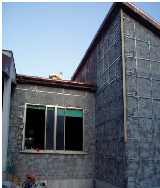
Adeguamento sismico di edificio scolastico in muratura, durante la chiusura estiva, senza lo smontaggio degli infissi e degli impianti. (Molise)

Non potendo ridurre l'intensità del terremoto, non rimane che ridurre la vulnerabilità delle costruzioni, rafforzandone le capacità di resistere agli eventi sismici, mediante soluzioni progettuali affidabili, nella realizzazione delle nuove costruzioni e nell'adeguamento di quelli esistenti sia in c.a. che in muratura.