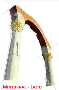
MINTURNAE - LAZIO